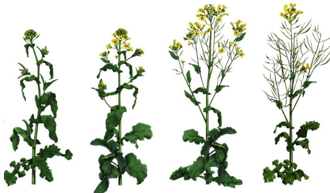
57-59 Første kronblad synlig